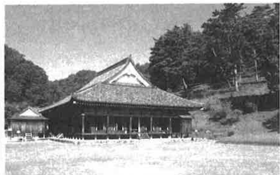
特別史跡 旧閑谷学校