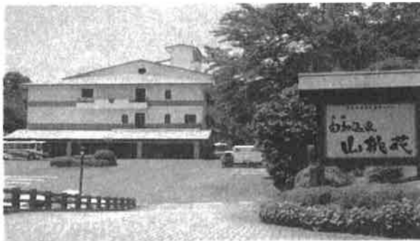
由加温泉ホテル山桃花